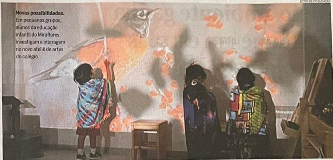
Novas possibilidades. Em pequenos grupos, alunos da educação infantil do Miraflores investigam e interagem no novo ateliê de artes do colégio

Além de artistas convidados, teatro, música e realidade virtual com a Casa da Descoberta (UFF), entre outras atrações, a escola le-